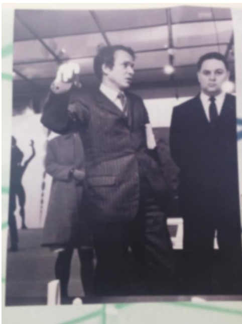
Exposition Le Corbusier-février 1969