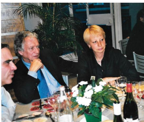
40 ans de la Comédie de Bourges-MCB mai2001

la Culture et qui ne pouvait plus recevoir de concert dans le grand salon ; sans moyens, nous avons réalisé un espace scénique et des gradins.