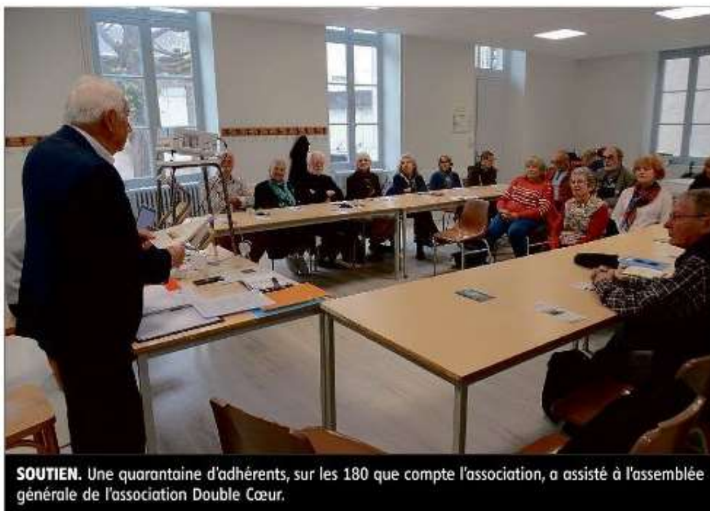
SOUTIEN. Une quarantaine d'adhérents, sur les 180 que compte l'association, a assisté à l'assemblée générale de l'association Double Cœur.